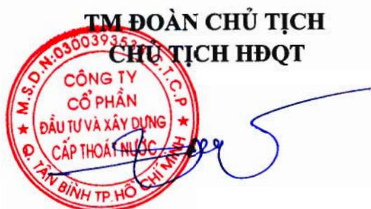
NGUYỄN ĐỨC BÔN

Đại hội cổ đông thường niên năm 2013 Công ty cổ phần Đầu tư và xây dựng cấp thoát nước (WASECO) kết thúc vào lúc 12h30 cùng ngày.